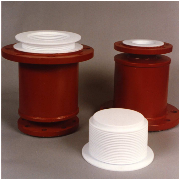
PTFE-ausgekleidete Ausgleichsbehälter mit Faltenbalg für Rohrsysteme